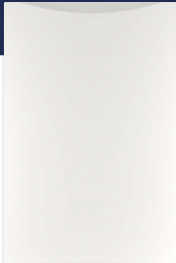
Ф315.Г Ярко-белый Фасад глухой M9001