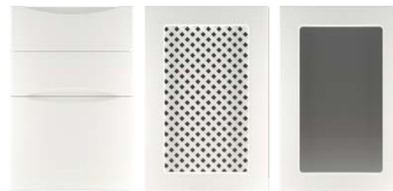
Ф315.Я Накладка на ящик Ф315.В Фасад под решетку Ф315.В Фасад под стекло