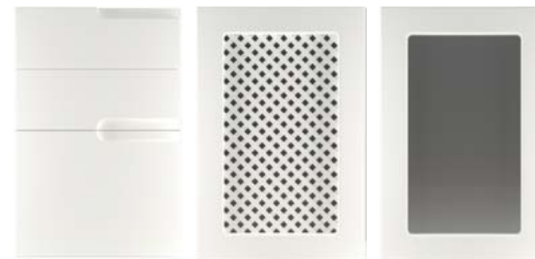
Ф310.Я Накладка на ящик Ф310.В Фасад под решетку Ф310.В Фасад под стекло