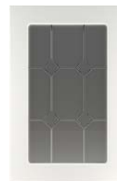
Ф310.В Фасад под витраж