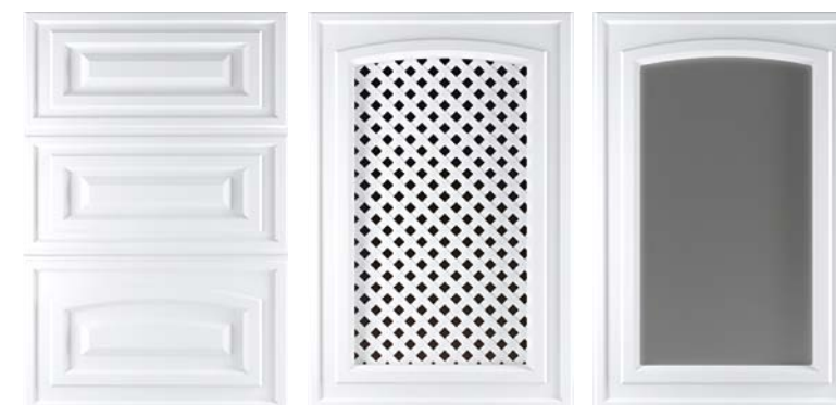
Ф260.Я Накладка на ящик Ф260.В Фасад под решетку Ф260.В Фасад под стекло