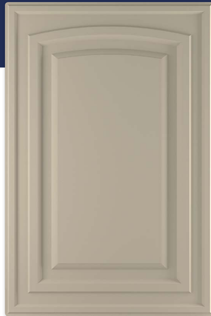
Ф260.Г Фасад глухой