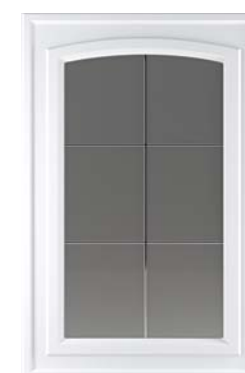
Ф260.В Фасад под витраж