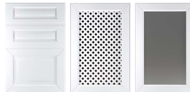
Ф255.Я Накладка на ящик