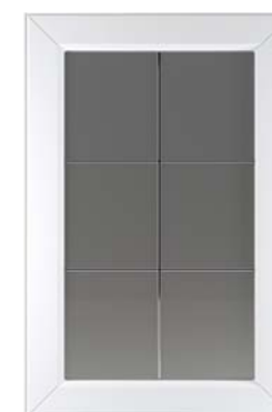
Ф255.В Фасад под витраж