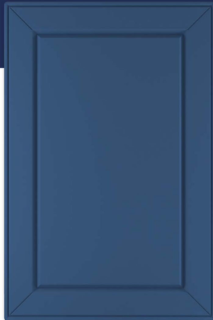
Ф255.Г Фасад глухой