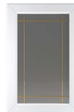
Ф250.В Фасад под витраж