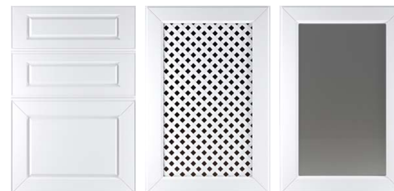
Ф250.Я Накладка на ящик Ф250.В Фасад под решетку Ф250.В Фасад под стекло