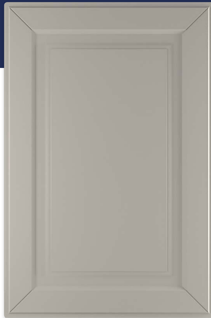
Ф250.Г Фасад глухой