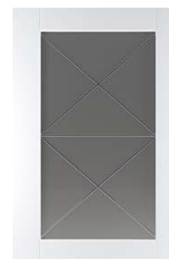
Ф245.В Фасад под витраж