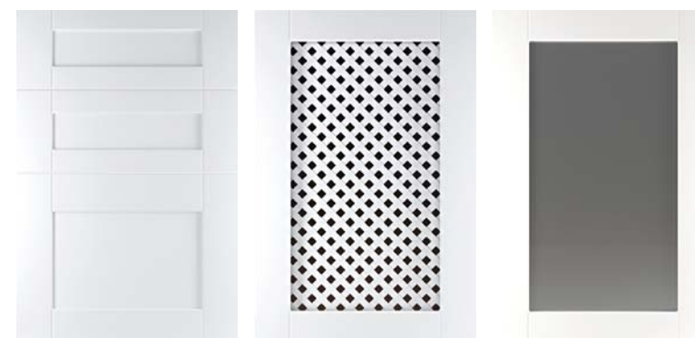
Ф245.Я Накладка на ящик