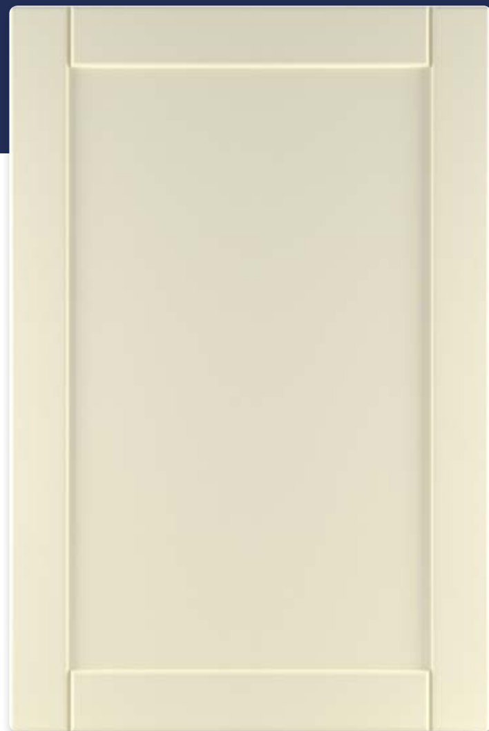
Ф220.Г Фасад глухой