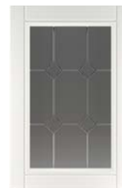
Ф220.В Фасад под витраж