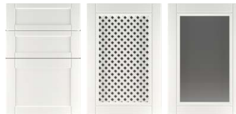
Ф220.Я Накладка на ящик