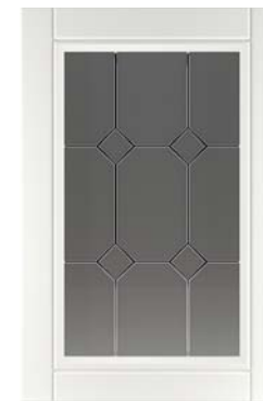
Ф215.В Фасад под витраж