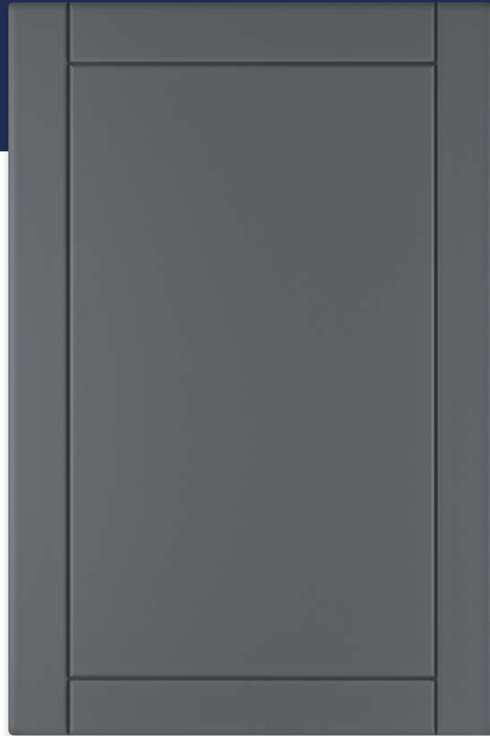
Ф215.Г Фасад глухой