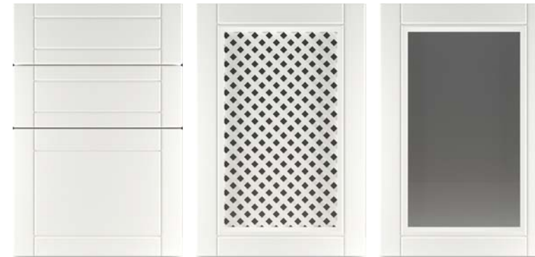
Ф215.Я Накладка на ящик Ф215.В Фасад под решетку Ф215.В Фасад под стекло